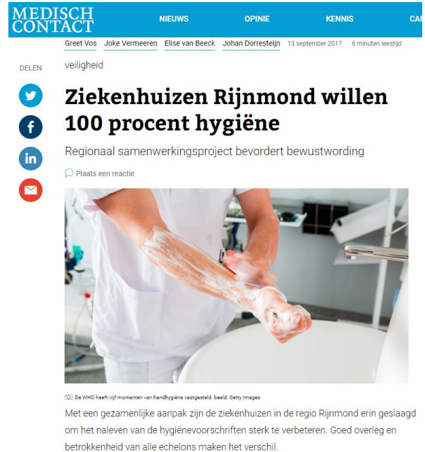
Figuur 3: Artikel in Medisch Contact (nr. 37)

Rest pagina twee voor informatie uit eigen zorginstelling, verder in te vullen door projectleider